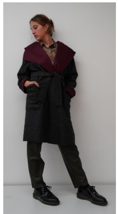
Gr. 38 Material: Woll-Walk/Baumwolle Preis: CHF 85.-