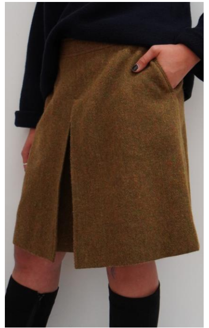
Gr.38 Material: Harrys Tweed Wolle Preis: CHF 75.-