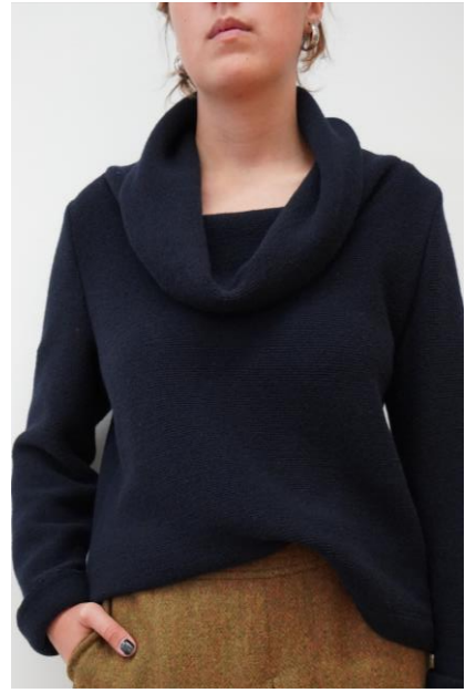
Gr.38 Material: Schurwolle Preis: CHF 70.-