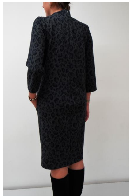
Gr.38 Material: Viskose/Wolle/Jersey Preis: CHF 90.-