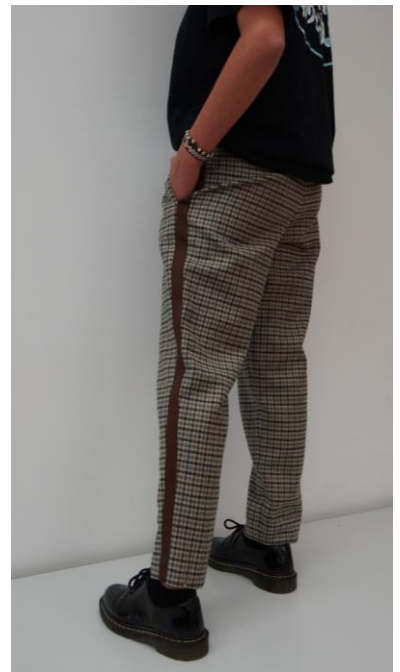
Gr.38 Material: Schurwolle Preis: CHF 75.-